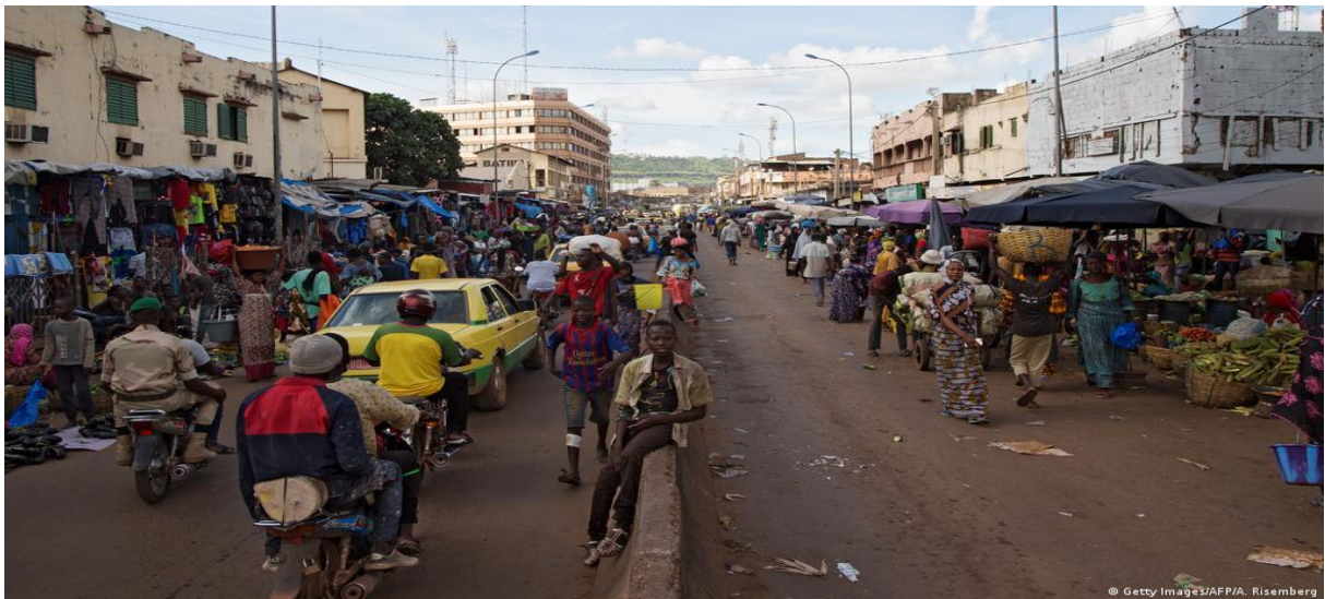
(Grand marché du District de Bamako)

De nos jours, il existe deux formes de commerce dans le District de Bamako : le commerce informel et le commerce formel .