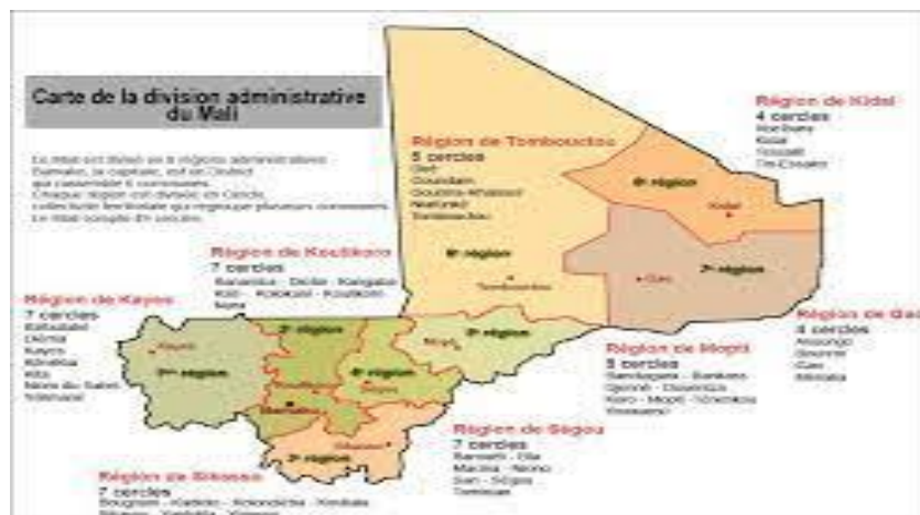
(Carte division administrative du District de Bamako)